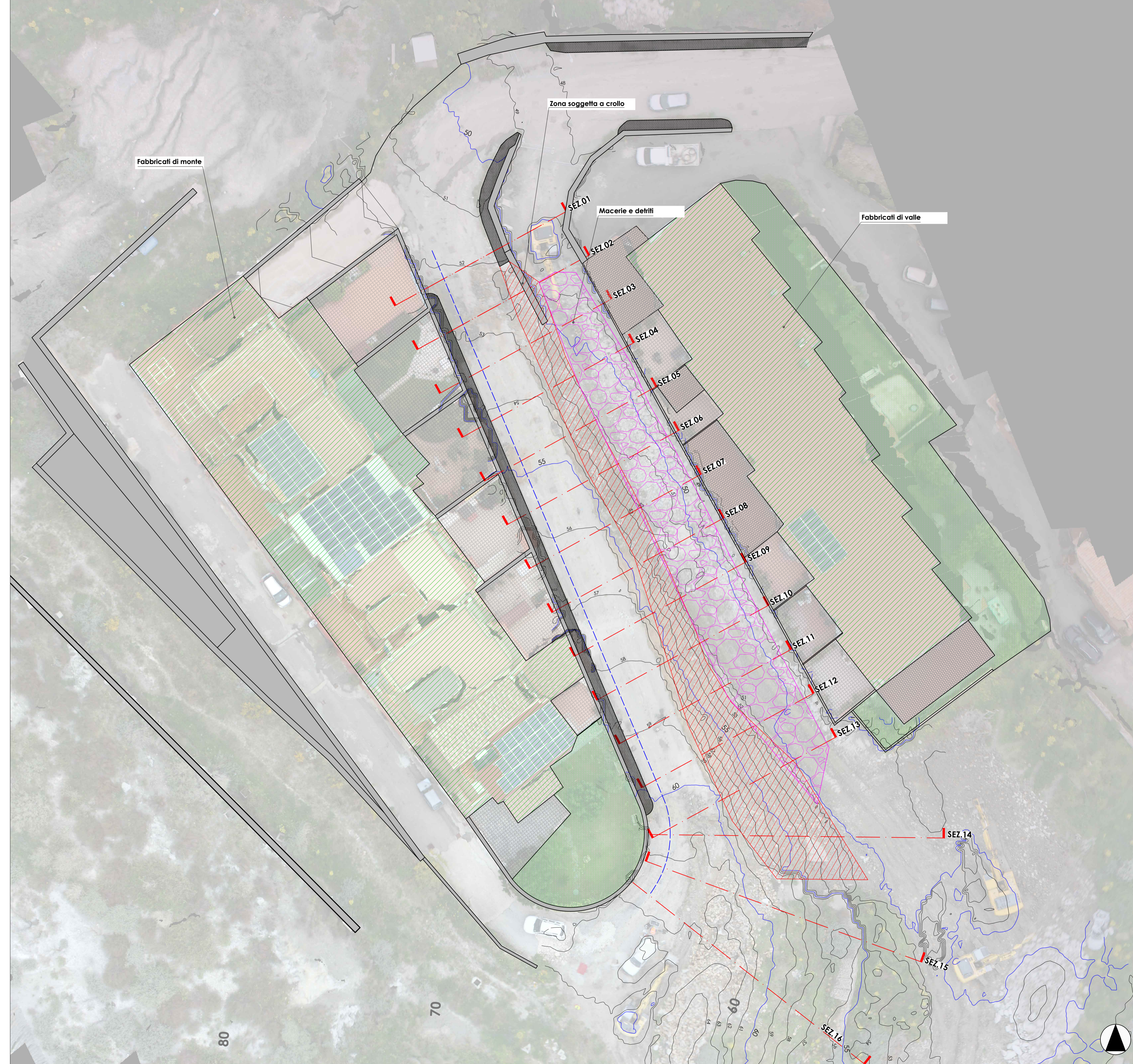
PLANIMETRIA STATO DI FATTO - SCALA 1: 200