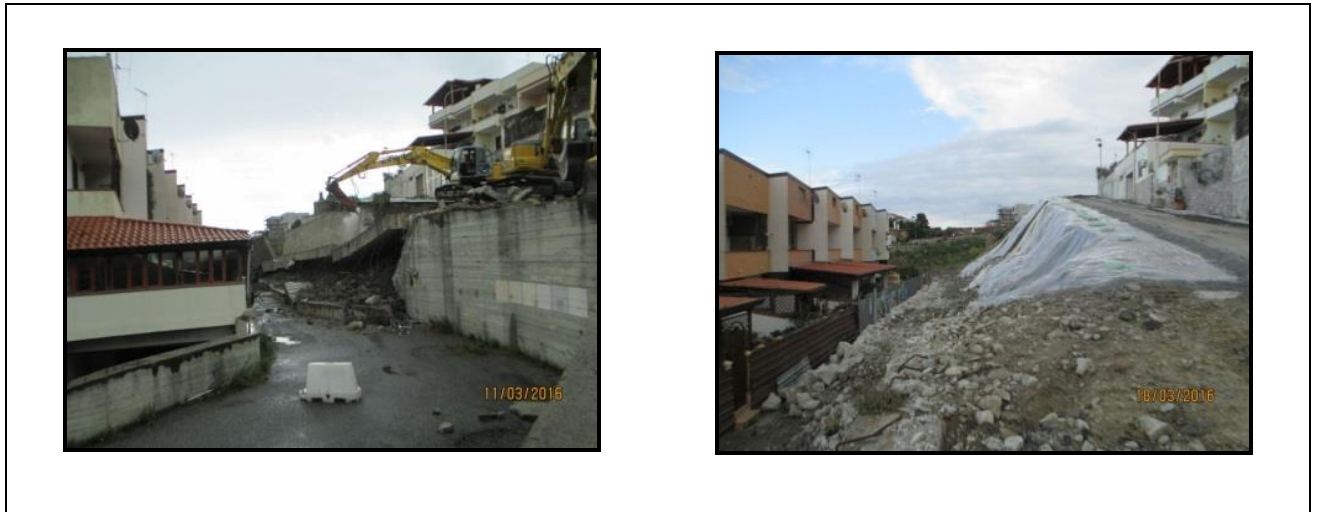
Figura 1 - Foto del sito negli istanti immediatamente successivi al crollo e dopo l'intervento di demolizione .