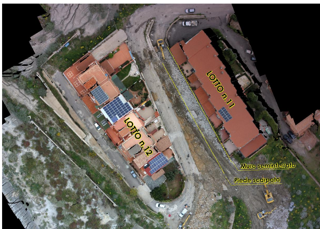
Figura 2 - Ubicazione lotti.

La scelta delle fondazioni profonde (pali) risponde all'esigenza principale di evitare che le azioni trasmesse da un'eventuale fondazione superficiale dell'opera di sostegno possano andare a gravare sul vicino muro del piano seminterrato del fabbricato di valle (Lotto 11).